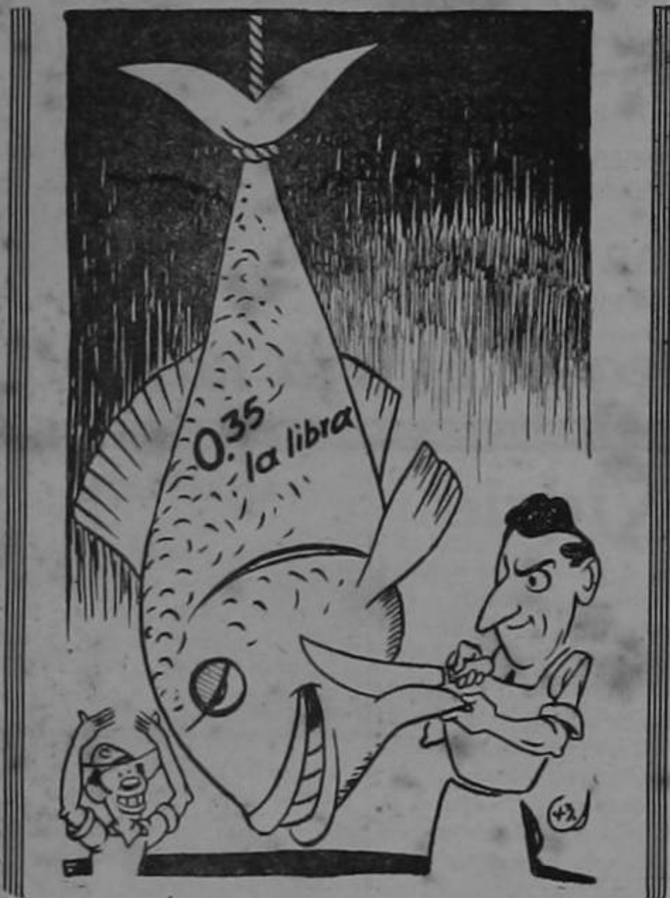
Tendrá el pueblo esta ocasión económico banquete, porque el Doctor Calderón realiza lo que promete!

día de las elecciones, un imponente desfile de mujeres cortesistas