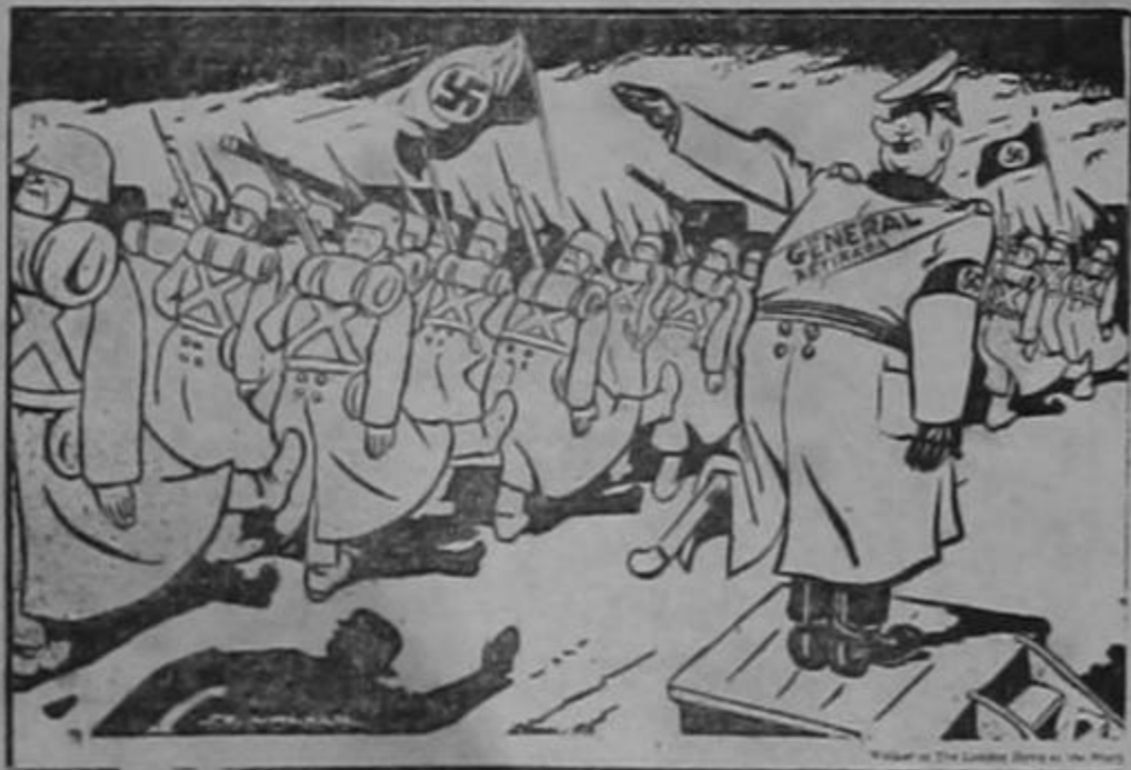
El General Retirado pasa revista a sus tropas...