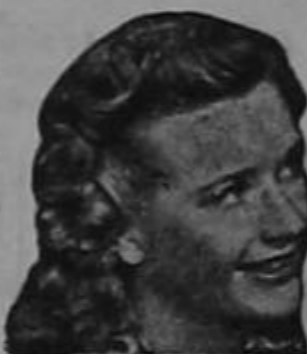
Priscilla Lane de la Warner Bros

LA cara, los brazos y las manos adquieren un aspecto fresco y encantador aplicando Crema Primavera antes de empolvarse. Véalo en su espejo. El cutis marchito y macilento se esfuma y aparece la piel rosada y transparente que es tan atractiva y tan admirada.