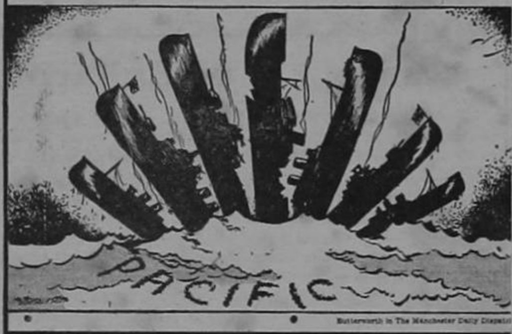
Butterworth in The Manchester Daily Express