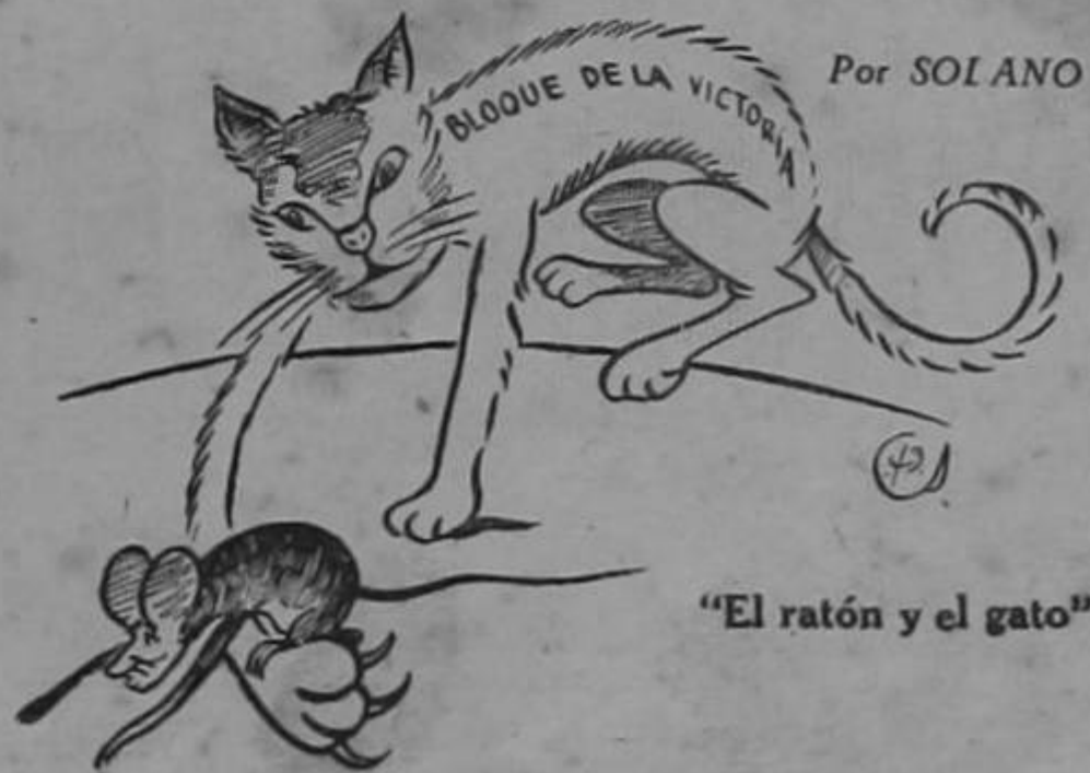
"El ratón y el gato"