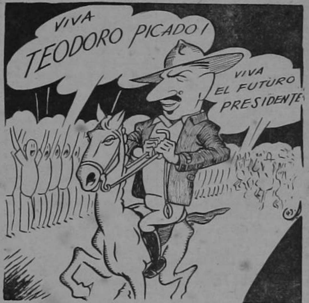
Donde quiera que haya ido hay apoteosis completas para Picado el caudillo; en cambio, EL OTRO ha salido con el rabo entre las piernas!