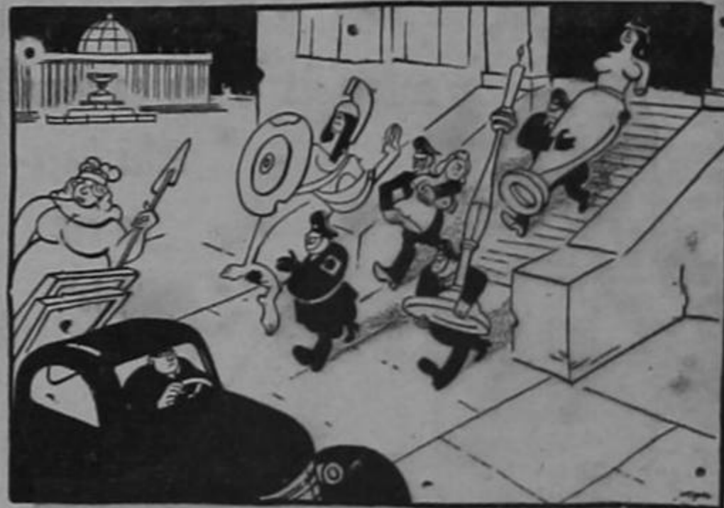
Los progresos que Alemania ha hecho en el arte, bajo el mando del Fuehrer, están llegando a su punto máximo...