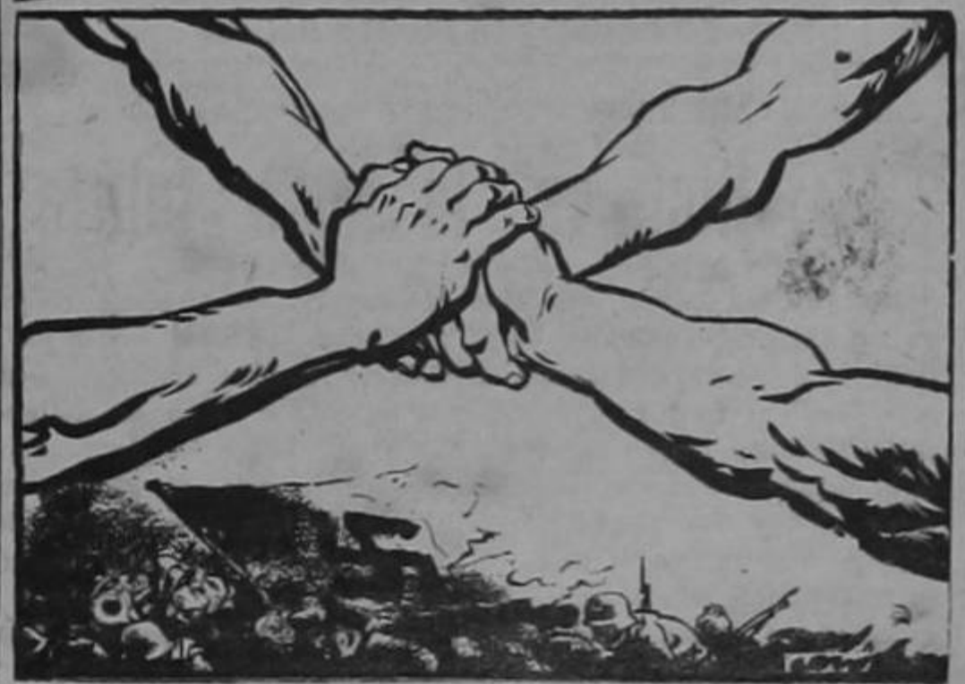
LAS NACIONES UNIDAS

—Señor, respondió el bailarín, soy comandante de un cuerpo en el que sirve usted desde hace mucho tiempo.